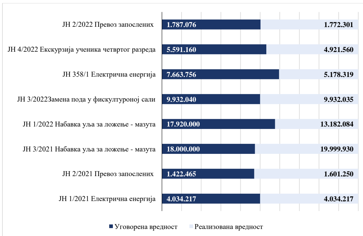
Графикон број 1: Реализација ЈН у посматраном периоду

У циљу одговора на ревизијска питања, ревидирали смо поступке јавних набавки, које смо приказали у Прилогу 2 извештаја.