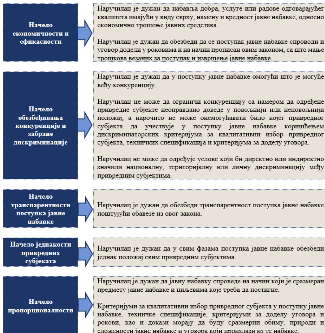
Слика број 1: Начела јавне набавке 32

Наручилац је дужан да посебним актом ближе уреди начин планирања, спровођења поступка јавне набавке и праћења извршења уговора о јавној набавци (начин комуникације, правила, обавезе и одговорност лица и организационих јединица), начин планирања и спровођења набавки на које се закон не примењује, као и набавки друштвених и других посебних услуга. наручилац је дужан да предметни акт објави на својој интернет страници. 33